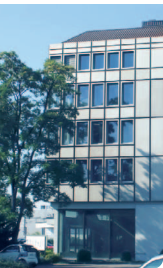
Das itelligence-Rechenzentrum in Glattbrugg.

Die Anforderungen an Ihre SAP-Systeme sind hoch: Eine gesicherte Verfügbarkeit, hohe Flexibilität und den Schutz vor Fremdzugriffen können Sie nur durch den Aufbau und Erhalt einer entsprechenden Infrastruktur und eines hohen Know-hows erreichen. Damit werden permanent personelle und materielle Ressourcen gebunden, die der Betreuung der eigentlichen Geschäftsprozesse Ihrer Unternehmung nicht zur Verfügung stehen. Warum betreiben Sie Ihre SAP-Landschaft eigentlich noch selbst?