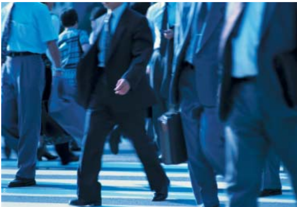
Unabhängig von Schalteröffnungszeiten greifen die Bürger via Internet jederzeit und von überall her auf die Dienstleistungen einer Verwaltung zu.

■ Planung/Budgetierung: Der optimale Einsatz der immer knapper werdenden Mittel und das schnelle Reagieren auf veränderte Situationen erfordern eine immer bessere Unterstützung der Planungs- und Budgetierungsprozesse. Mit mySAP Financials