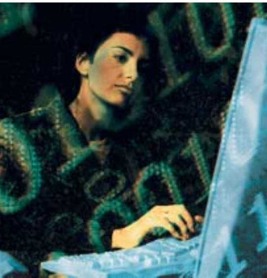
Über ein Online-Portal kann eine breite Vielfalt an Prozessen von Bürgern, Mitarbeitern und Lieferanten in ein integriertes System eingebunden werden.